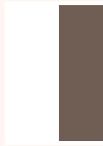
Demi page verticale 90 x 260 mm